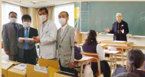
横浜西部病院へフェイスシールド寄贈