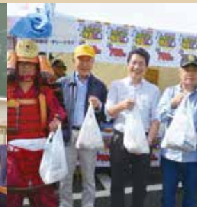
鶴ヶ峰中学職業講話