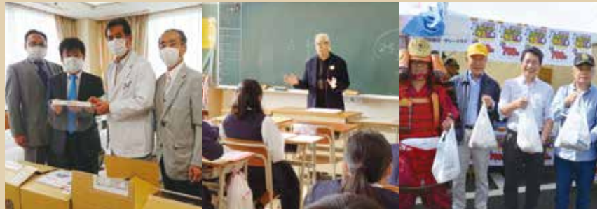
横浜西部病院へフェイスシールド寄贈

事務所 横浜市旭区二俣川1-37-3 NUTS1階／〒241-0821 TEL.045-465-6702／FAX.045-465-6712 http://yokohamaasahirc.cho88.com Email:asahirc@titan.ocn.ne.jp 例会場 横浜市旭区二俣川1-45-30工藤ビル (榊岡田屋3階会議室) 例会日 毎週水曜日／12時30分～1時30分