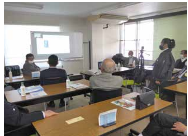
リモートでの卓話を聞く会員の皆様の様子