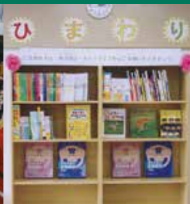
在日外国人日本語学習支援