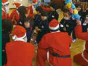
被災地の子ども達にXマスプレゼント