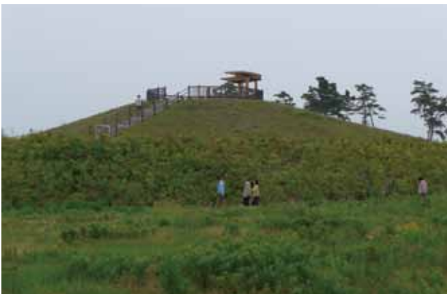
6月14日以前植樹した「千年希望の丘」