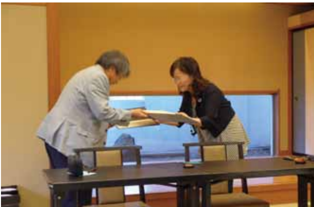
6月13日災害時相互支援協定締結式