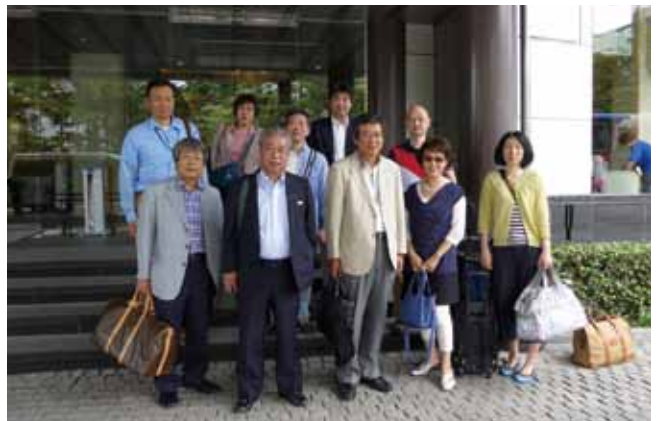
6月14日宿泊ホテルニュー水戸屋前にて