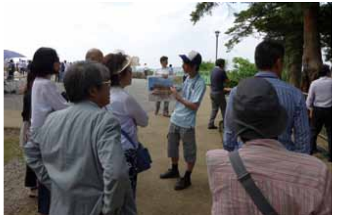
6月13日仙台城（青葉城）見学