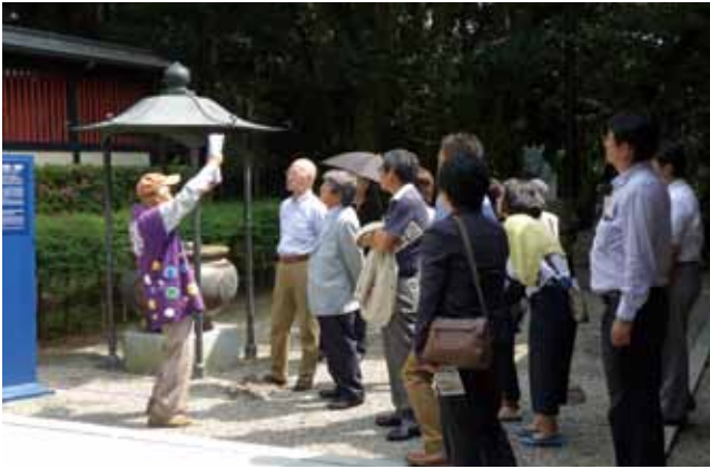
6月13日仙台藩祖 伊達政宗公霊屋 瑞鳳殿