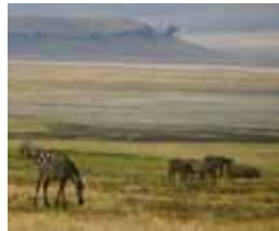
湿地帯エリアイメージ