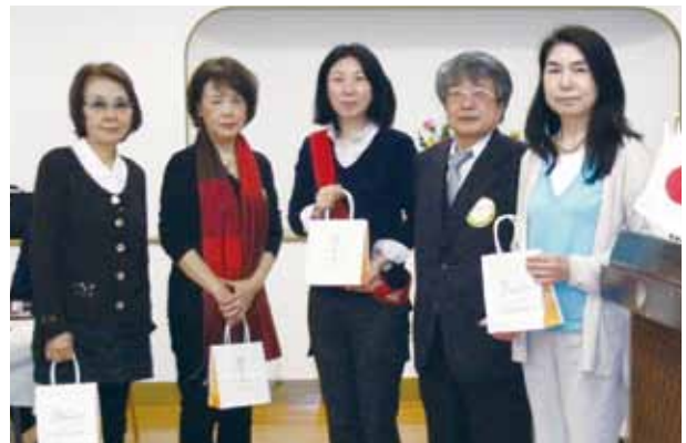
左より川瀬会員、桜田会員 二宮会員 漆原会員