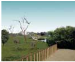
草原エリアからクロサイ展示場、湿地帯エリアのイメージ